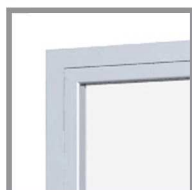
Porte in alluminio Alluminium doors ELEAFOR