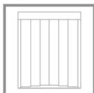
Porte automatiche Automatic sliding doors