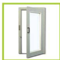
Porte a battente Swing doors