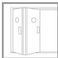
Porte articolate By-folding doors